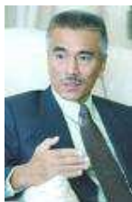
Jefe de Estado y de Gobierno: Anoto Tong

Principales partidos políticos: Partido Boutokanto Koaava; Partido Maneaban Te Mauri; Partido Maurin Kiribati Pati.