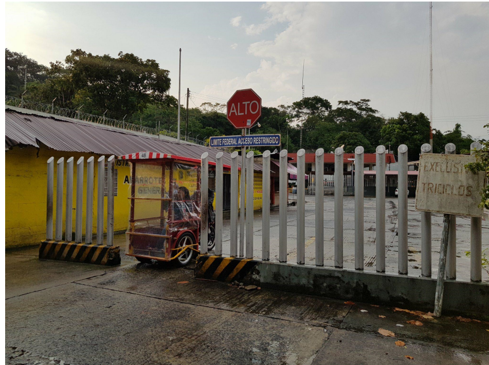
GOBERNANZA DESDE ARRIBA