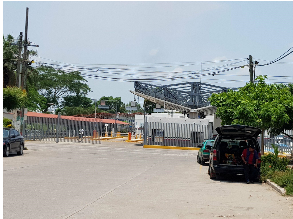
GOBERNANZA DESDE ARRIBA