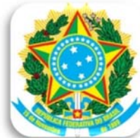
Escudo de Armas 2