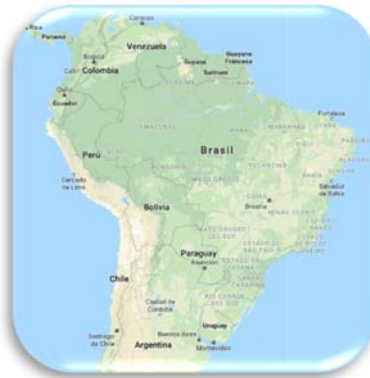
Ubicación geográfica de Brasil