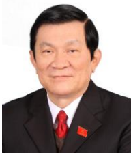
Presidente: Sr. Trương Tấn Sang

El actual Gobierno tomó posesión tras la constitución de la XIII Asamblea Nacional derivada de las elecciones celebradas el 22 de mayo de 2011. Desde la reelección del primer ministro Nguyễn Tấn Dũng, Vietnam ha logrado un crecimiento sostenido gracias a la política de apertura económica del país, lo que ha permitido estabilidad política y la búsqueda de una nueva legislación que promueva la expansión de sus mercados al exterior, así como el fortalecimiento de la economía interna. No obstante, se ha criticado al primer ministro Dũng por la falta de logros de su gobierno, particularmente en materia de desarrollo social. Su segundo período propone una ambiciosa estrategia de progreso para el país. El Plan de Desarrollo Económico-Social 2011-2015 busca lograr un crecimiento del PIB de 6.5%, crear ocho millones de empleos y reducir la pobreza. Estas metas no se han podido lograr debido a la relativa vulnerabilidad de la economía vietnamita.