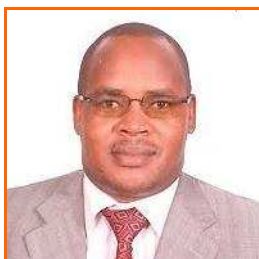
Diputado Jackson Kiplagat Kiptanui.