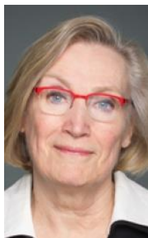
Caroyln Bennett, Ministra de Asuntos Indígenas y del Norte