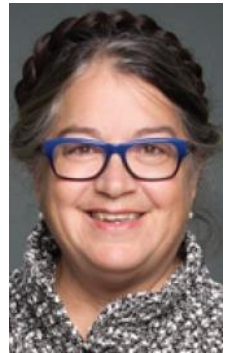
Diane Lebouthillier, Ministra de Ingresos Nacionales