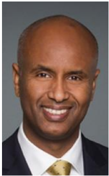
Ahmed D. Hussen, Ministro de Inmigración, Refugiados y Ciudadanía