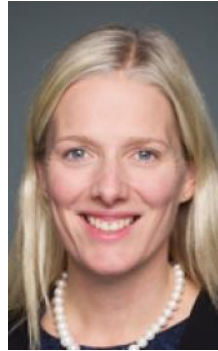
Catherine McKenna, Ministra de Medio Ambiente y Cambio Climático