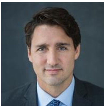
Justin P. J. Trudeau Primer Ministro