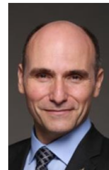
Jean-Yves Duclos, Ministro de Familia, Niñez y Desarrollo Social