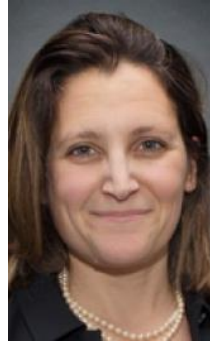
Chrystia Freeland, Ministra de Asuntos Exteriores