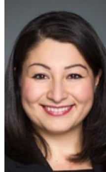
Maryam Monsef, Ministra del Estatus de la Mujer