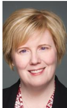
Carla Qualtrough, Ministra de Deporte y Personas con Discapacidad