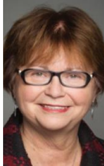
Judy M. Foote, Ministra de Servicios Públicos y Adquisiciones