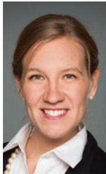
Karina Gould, Ministra de Instituciones Democráticas