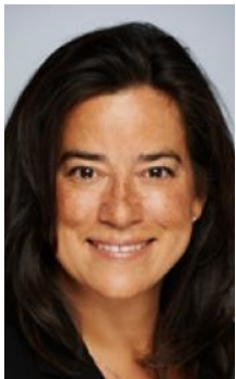
Jody Wilson-Raybould, Ministra de Justicia y Fiscal General de Canadá