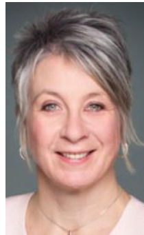
Patricia A. Hajdu, Ministra de Empleo, Desarrollo de la Fuerza Laboral y Trabajo