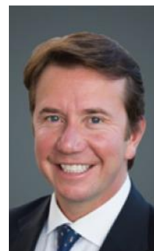
Scott Brison, Presidente del Consejo del Tesoro