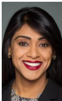
Bardish Chagger Líder del Gobierno en la Cámara de los Comunes y Ministra de Pequeñas Empresas y Turismo