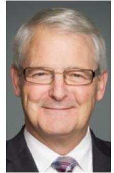
Marc Garneau, Ministro de Transporte