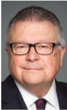
Ralph Goodale, Ministro de Seguridad Pública y Preparación ante Emergencias