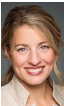
Mélanie Joly, Ministra de Patrimonio Canadiense