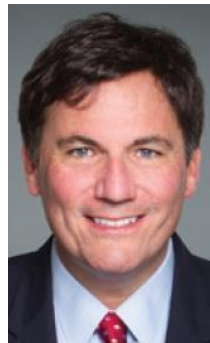
Dominic LeBlanc, Ministro de Pesca, Océanos y Guardia Costera Canadiense