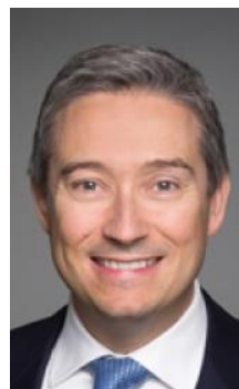
François-Philippe Champagne, Ministro de Comercio Internacional