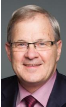
Lawrence MacAulay, Ministro de Agricultura y Agroalimentos