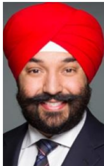
Navdeep Singh Bains, Ministro de Innovación, Ciencia y Desarrollo Económico