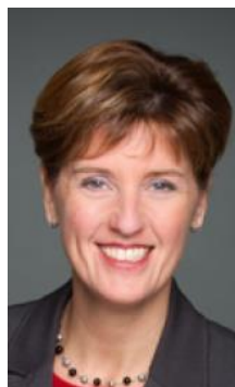
Marie-Claude Bibeau, Ministra de Desarrollo Internacional y Francofonía