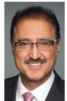
Amarjeet Sohi, Ministro de Infraestructura y Comunidades