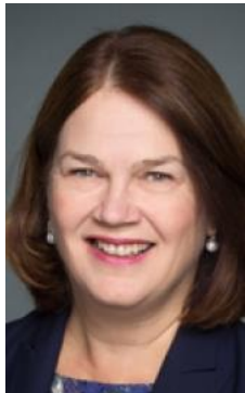
Jane Philpott, Ministra de Salud