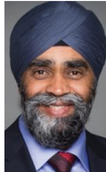
Harjit Singh Sajjan, Ministro de Defensa Nacional