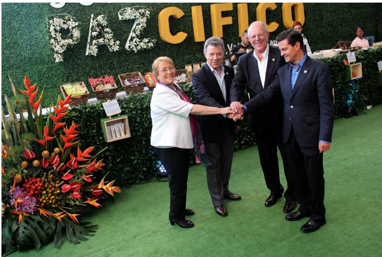
Mandatarios de Chile, Colombia, Perú y México durante la XII Cumbre de la Alianza del Pacífico en Cali, Colombia 1

El 30 de junio de 2017 se llevó a cabo la XII Cumbre Presidencial de la Alianza del Pacífico en donde participaron los mandatarios de México, Perú, Chile y Colombia, integrantes de este bloque de integración. Como resultado de la Cumbre se suscribió la Declaración de Cali, que da la bienvenida por primera vez a las solicitudes de otros países para ser “Estados Asociados”. Durante la Cumbre, los Presidentes han reiterado su compromiso con este proceso de integración y con el libre comercio, con miras en la integración regional.