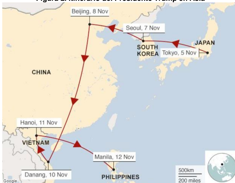
Figura 2. Itinerario del Presidente Trump en Asia