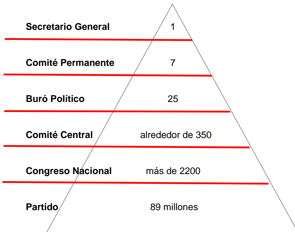
Cuadro 2. Numeralia del PCCh