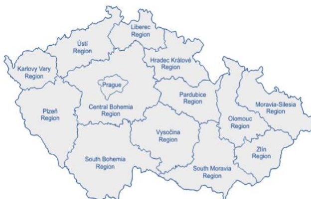
Cuadro 2: Regiones en República Checa

En el año 2000, el sistema de regiones fue instaurado y un año después, se estableció la Asociación de Regiones, en la que se promueven los intereses de los ciudadanos a partir de las divisiones territoriales. La Asociación de Regiones es representada por el Alcalde de la Ciudad de Praga. La principal actividad de la Asociación es expresar los intereses de las Regiones en el Parlamento, el Gabinete y las instituciones europeas así como de promover iniciativas. El campo de acción de las Regiones es incidir en temas de administración pública, sistemas de salud, sistemas educativos, tecnología y reformas al sistema de seguridad social. Desde su establecimiento, las regiones y la Asociación actúan bajo los principios der la Carta Europea de Gobiernos locales. 19