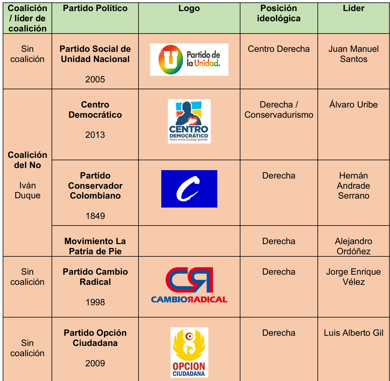
Tabla 3. Principales Partidos Políticos de Colombia

Los comicios legislativos se encuentran ampliamente vinculados con la elección presidencial que tendrá lugar el próximo mes de mayo, ya que los candidatos al Ejecutivo de los partidos que obtuvieron el mayor porcentaje de votos en las legislativas se verán favorecidos dado que es poco probable que los electores modifiquen el sentido de su voto en mayo.