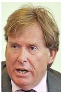
Sir Simon Burns Ex Ministro de Estado para la Salud