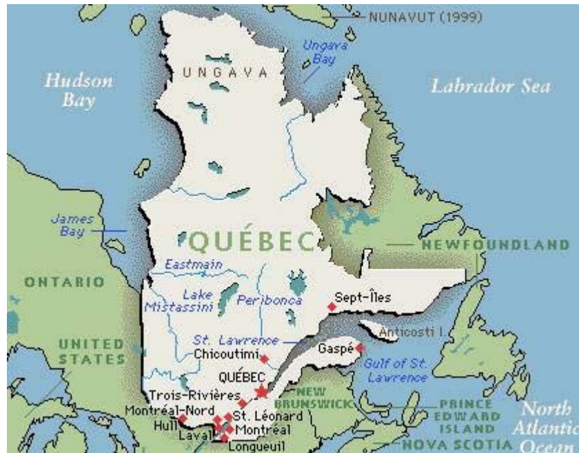
IMAGEN 1. MAPA DE QUEBEC