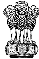
सत्यमेव जयते Escudo 3