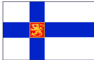
Bandera Oficial del Estado 2