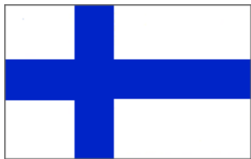
Bandera Nacional 1