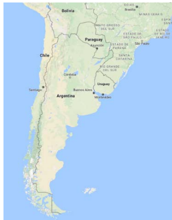
Ubicación Geográfica de Argentina