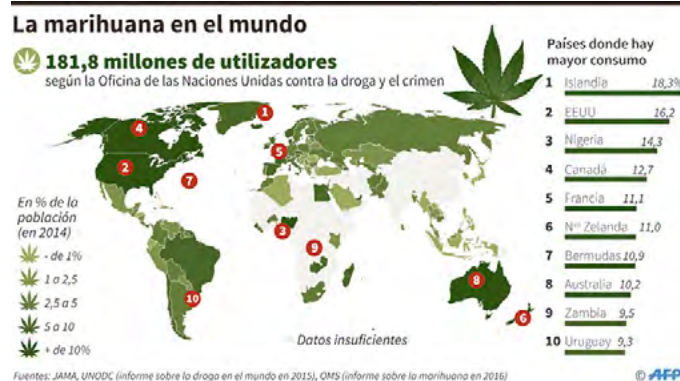
Imagen 2. Países con mayor consumo de marihuana 2015

En 2016 la ONU hizo un llamado para un nuevo modelo en la política de combate contra las drogas con una visión de salud pública y atención a grupos vulnerables ya que las legislaciones punitivas no han logrado disminuir su consumo. La marihuana continúa siendo una de las drogas más cultivadas y consumidas a nivel mundial.