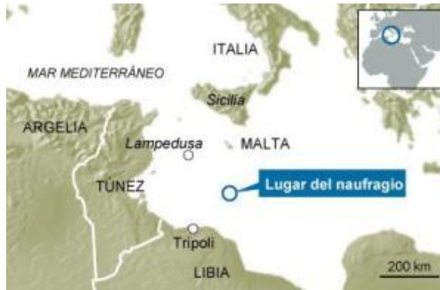
Mapa 1. Lugar del naufragio

Fuente: Pablo Ordaz, “700 inmigrantes desaparecidos tras hundirse su barco en aguas libias”, El País , 19 de abril de 2015. Consultado el 20 de abril de 2015 en: http://internacional.elpais.com/internacional/2015/04/19/actualidad/1429431225_038632.html