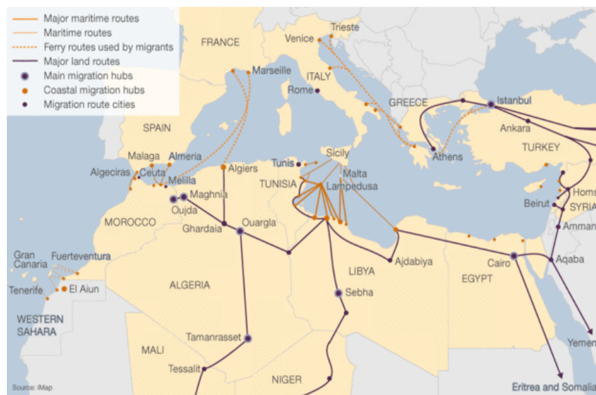
Mapa 2. Principales rutas migratorias del norte de África y Medio Oriente hacia el sur de Europa