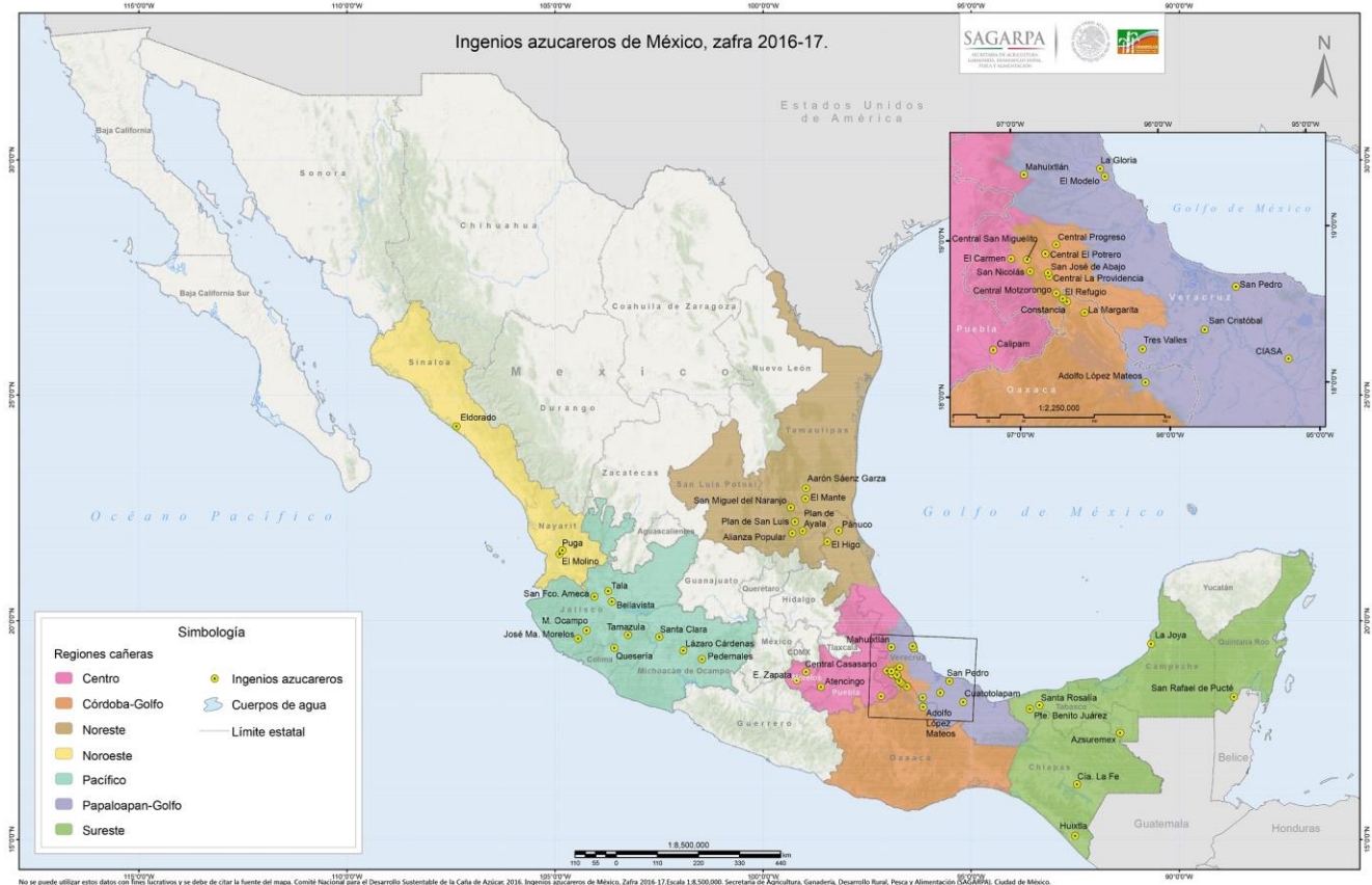
Figura 2. Estados de México que conforman las regiones cañeras y con presencia de ingenios azucareros

aproximado de 58% de su población viviendo en esa condición. 21 Es decir, varias de las entidades azucareras son de las que más apoyo requieren a nivel nacional.