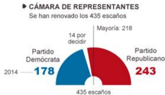
Gráfico 2: Composición de la Cámara de Representantes tras las elecciones intermedias de 2014 13

En esta Cámara también se cumplió el escenario esperado, pues los Republicanos no sólo mantuvieron la mayoría, sino que incrementaron su número de asientos. Hasta el momento, los resultados preliminares indican que los Republicanos habrían obtenido 243, mientras que los Demócratas redujeron su número de curules hasta 178. Cabe subrayar que aún continúan 14 asientos en disputa, pero el resultado no es relevante bajo la perspectiva de que los Demócratas no conseguirán arrebatarle la mayoría a los Republicanos. A continuación se ofrece una infografía con los resultados preliminares: