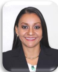
Sen. Gabriela Benavides Cobos

Presidenta de la Comisión de Relaciones Exteriores Europa