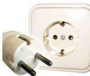
Tipo F: Válido para clavijas C