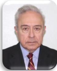
Sen. Héctor Vasconcelos

Presidente de la Comisión de Relaciones Exteriores