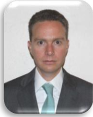
Sen. Manuel Velasco Coello

Coordinador del Grupo Parlamentario del Partido Verde Ecologista de México (PVEM)