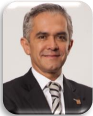
Sen. Miguel Ángel Mancera Espinosa

Coordinador del Grupo Parlamentario del Partido de la Revolución Democrática (PRD)