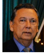
DIPUTADO JUAN ALFONSO FUENTES SORIA (República Dominicana)