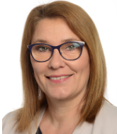
DIPUTADA BEATA MAZUREK (Polonia)