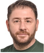
DIPUTADO NIKOS ANDROULAKIS (Grecia)