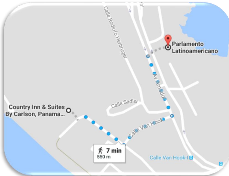
Mapa de ubicación del hotel sede respecto al edificio del Parlamento Latinoamericano y Caribeño.

Diferencia de horario: Panamá tiene +1 hora que México.