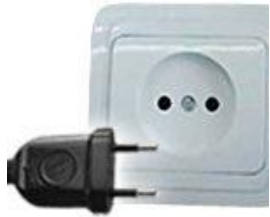
Tipo C: Válido para clavijas E y F

Las clavijas a utilizar en Cuba son del tipo A / B / C / L: