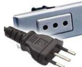
Tipo L: Válido para clavijas C