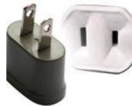
Tipo A: Clavijas japoneses A