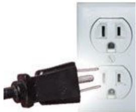
Tipo B: A veces válido para clavijas A