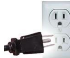
Tipo B: A veces válido para “Clavijas A”

Ambas clavijas son las de uso común en México.