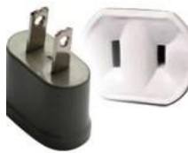
Tipo A: “Clavijas japonesas A”

Las clavijas a utilizar en Panamá son del tipo A / B: