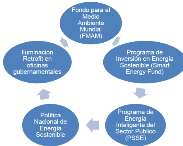
DIAGRAMA CICLO DE EFICIENCIA ENERGÉTICA PARA EL SECTOR PÚBLICO, EN EL MARCO DEL PROGRAMA ENERGÍA SOSTENIBLE PARA BARBADOS