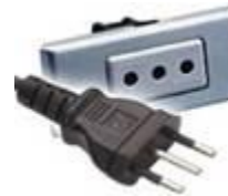
Tipo L: Válido para clavijas C