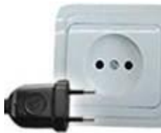
Tipo C: Válido para clavijas E y F

Las clavijas a utilizar en Chile son del tipo C / L: