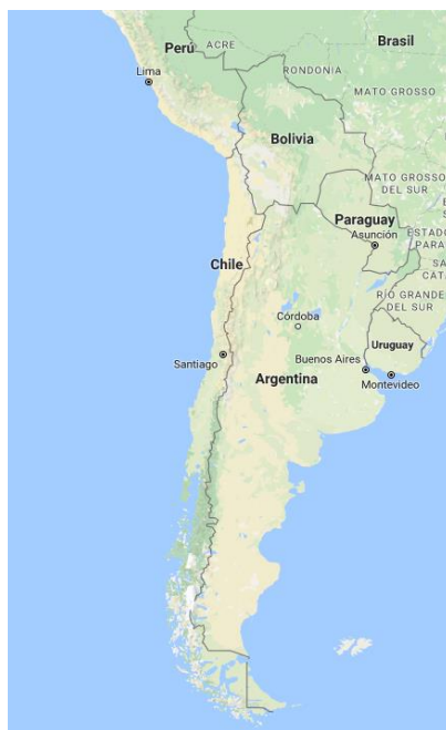
Ubicación de Chile