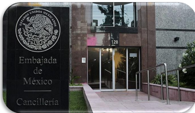
Embajada de México en Chile